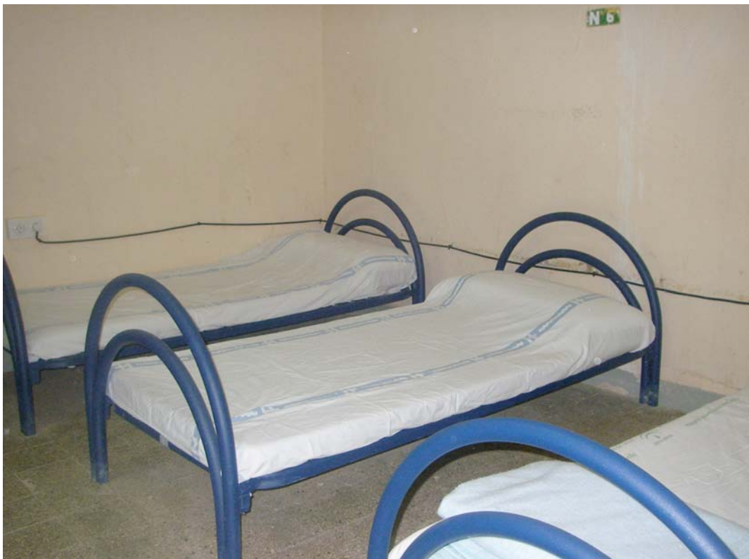
Hospital de Rabuni