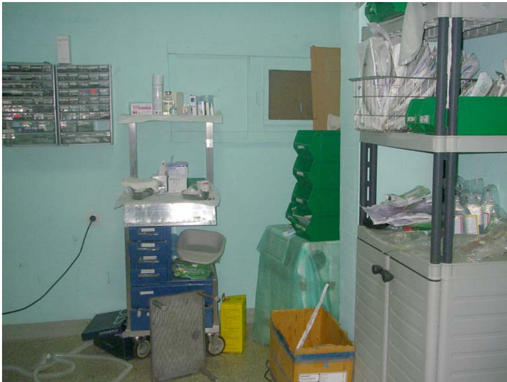
Hospital de Rabuni